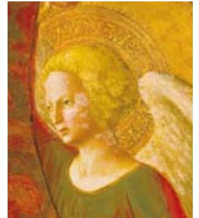
Masolino da Panicale, Madonna and Child with St. Anne (Galleria degli Uffizi, Florence) Enlarged image of the angels on the left and right.

With the latest technology, a new window opens into art appreciation and research. From cracks that have appeared over the years, it is possible to decipher not only the way art pieces have been preserved, but also the drawing techniques that existed at the time.